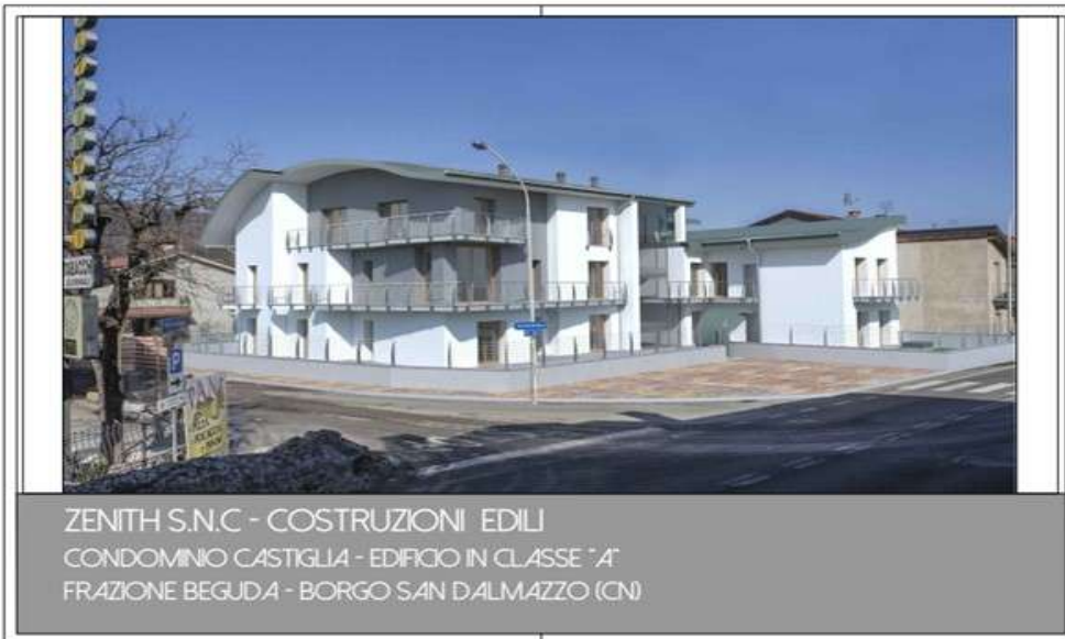
ZENITH S.N.C - COSTRUZIONI EDILI CONDOMINIO CASTIGLIA - EDIFICIO IN CLASSE "A" FRAZIONE BEGUDA - BORGO SAN DALMAZZO (CN)

Link: http://www.immobiliareparola.com/it/im_2931